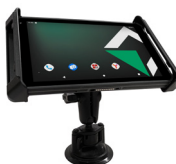
Держатель для крепления в транспортном средстве