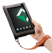
Аксессуары для удобства использования