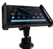
Держатель для крепления в транспортном средстве