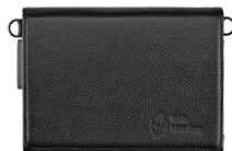
Аксессуары для удобства использования