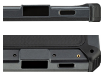
2D сканер штрих-кодов