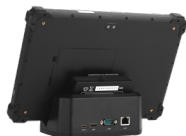
Док-станция для коммуникации и зарядки

Встроенный сканер 1D/2D кодов: работа в разных условиях освещенности, дальность считывания до 2 м.