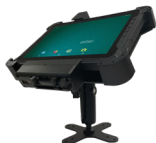
Крепление для использования в транспортном средстве