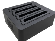
Зарядное устройство для аккумуляторов