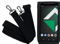
Аксессуары для ношения