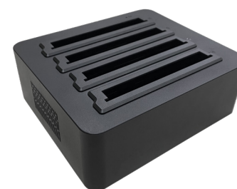
Зарядное устройство для аккумуляторов

Аккумулятор для планшетов MIG T8X x86 исполнение 51 и MIG T10 x86 исполнение 51. 5000 mAh, 7,6V.