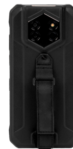
Ремешок на руку