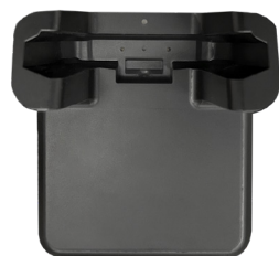
Док-станция для заряда аккумулятора