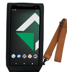
Утепленный чехол для взрывобезопасного MIG S6 с 2D сканером

Кожанный чехол для конфигурации смартфона MIG S6 с 2D сканером штрих-кодов, черный цвет, комплект с ремнем-петлей на руку.