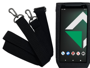
Чехол с ремнем на плечо

Кожанный чехол для смартфона MIG S6 черного цвета в комплекте с ремнем на руку. Подходит для конфигурации смартфона без сканера штрих-кодов.