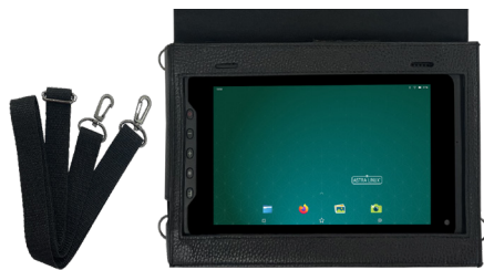
Чехол с крышкой