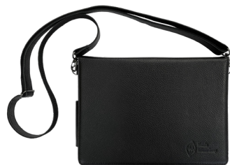
Чехол с крышкой