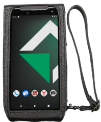
Кожанный чехол с ремнем