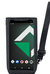
Утепленный чехол с ремнем

Чехол для MIG S6 из кожи черного цвета в комплекте с наплечным ремнем для удобства ношения. Длина ремня - 160 см. Подходит для смартфона без сканера штрих-кодов.