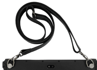
Ремень на плечо

Кожаный чехол для планшета MIG T10 x86 исполнение 51 с крышкой, в комплекте с ремнем.