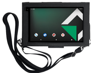
Чехол без крышки