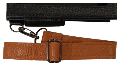
Ремень на руку для взрывобезопасного исполнения

Крестообразный наручный ремень. В комплекте 4 винта. Надевается на запястье и защищает планшет от падений.