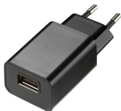
Блок питания USB