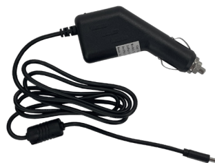
Зарядное устройство автомобильное

Блок питания для планшетов на x86 архитектуре: MIG T8X x86 исполнение 51 и MIG T10 x86 исполнение 51. USB-C, комплект с кабелем питания 2pin.