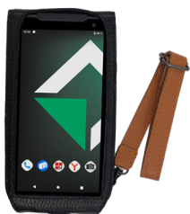
Чехол с ремешком для взрывобезопасного MIG S6

Утепленный кожаный чехол с наручным ремнем. Подходит для конфигурации смартфона MIG S6 без сканера штрих-кодов.