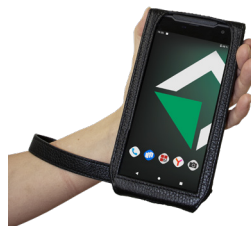
Кожанный чехол для MIG S6 с 2D сканером

Утепленный кожаный чехол для взрывобезопасного MIG S6 с ремешком из оранжевой кожи и креплением-карабином. Подходит для смартфона без сканера.