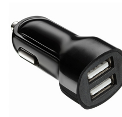
Зарядное устройство для автомобиля

Универсальный кабель USB C, 3.0, черный.