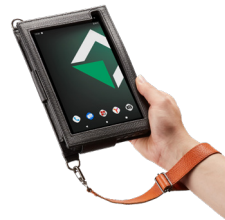
Чехол без крышки утепленный для взрывобезопасного исполнения

Кожаный чехол с петлей для стилуса и двумя кольцами, комплект с наплечным ремнем. Подходит для конфигурации планшета с 2D сканером штрих-кодов, модулем RTK и UHF RFID считывателем.