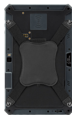
Крестообразный ремень на руку

Чехол из натуральной кожи для с крышкой. Оснащен петлей для стилуса и двумя кольцами. Комплект с ремнем. Чехол подходит для планшета с 2D сканером штрих-кодов, модулем RTK и UHF RFID считывателем.